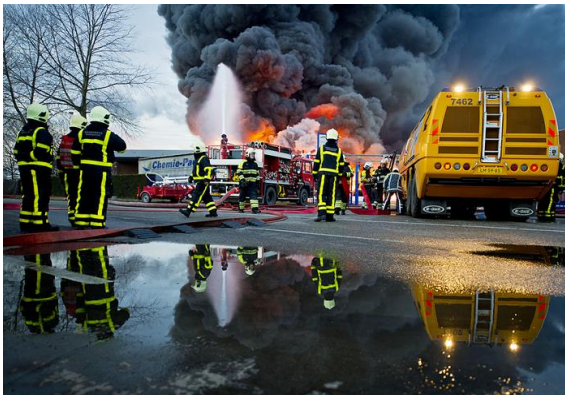
Brand Chemie-Pack (2011)

Plaatjes uit mijn presentatie CTGG-dag op 27 November 2015