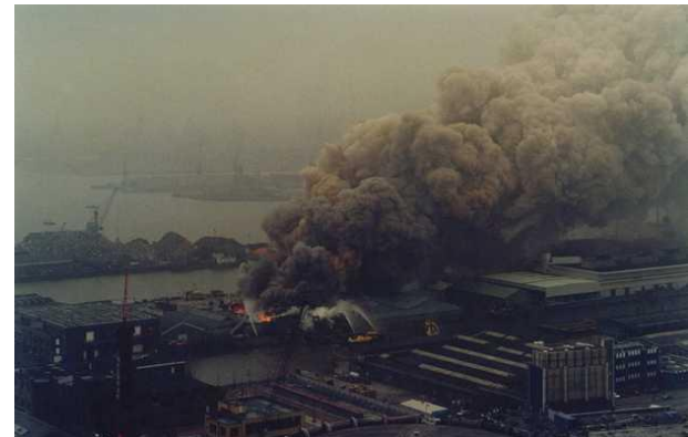
Brand CMI (1996)