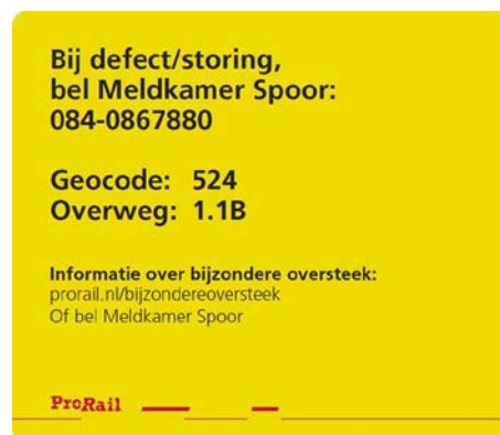
Figuur 3 voorbeeld van sticker om overweggebruikers te informeren over een bijzondere oversteek

ProRail heeft aanbeveling 3 voortvarend opgepakt. ProRail heeft een proces ingericht voor een bijzondere oversteek 15 . ProRail heeft haar procedure voor exceptionele transporten afgestemd met de RDW 16 en de vernieuwde procedure is via de RDW aan de brancheverenigingen gemeld. Overweggebruikers worden door middel van stickers (Figuur 3) op de paal van de overwegbomen/lampen geïnformeerd over deze procedure. ProRail verwacht dat eind 2018 alle overwegen van deze informatiesticker zijn voorzien.