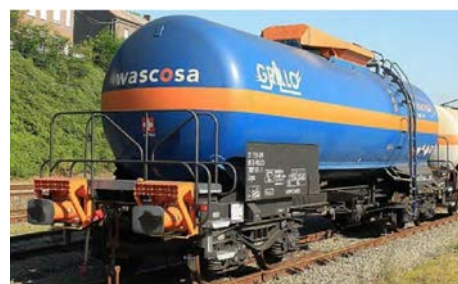
Figuur 1 voorbeeld van overbufferingbeveiliging (oranje) in combinatie met crashbuffers

De inspectie vindt het positief dat de chemiebedrijven: SABIC, OCI Nitrogen en AnQore in lijn met aanbeveling 2a geen operationele lastminutewijzigingen meer doorvoeren. In hun onderzoek naar de risicobeheersing van het vervoer van