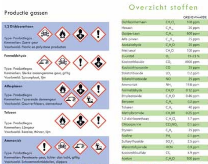
Figuur 3 Voorbeeld van een informatieblad

De Nederlandse versie van het actieplan gebruikt gedetailleerde stroomschema's (zie figuur 4) voor de veilige behandeling conform de drie containercategorieën, en verwijst naar zogenaamde 'tipkaarten' over verschillende procedures.